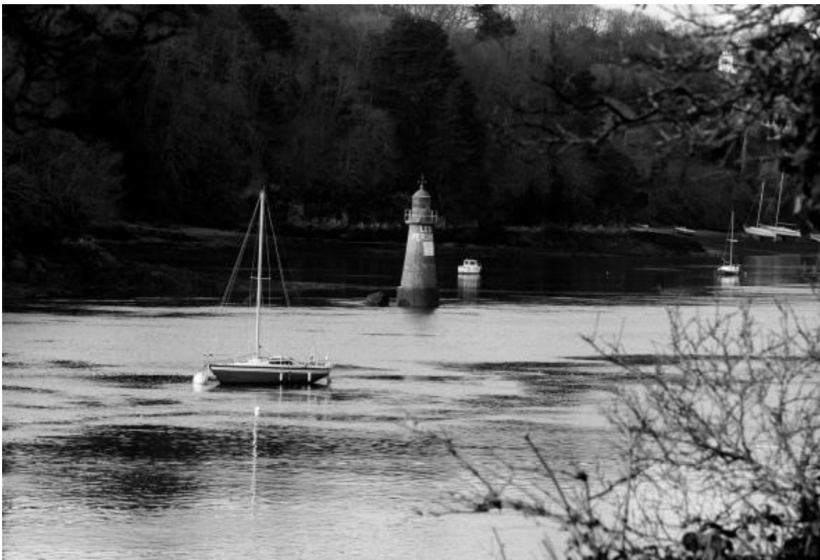
Figure 1: Rivière en Bretagne côté "Ar Mor"

Ces actions s'inscrivent dans une démarche générale « horizon 2030 » qui vise à définir et à améliorer l'urbanisation des communes dans les prochaines années. Le but est d'améliorer l'environnement et la qualité de vie.